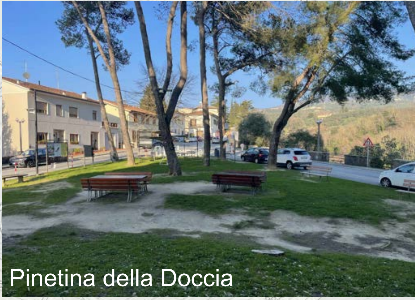
Pinetina della Doccia

L'area è importante per l'utenza turistica rivolta al Museo Leonardiano ed al borgo e come punto di partenza della "Strada verde", il percorso che da Vinci conduce alla Casa natale di Anchiano. Questo spazio appare oggi come una zona residuale, casualmente ritagliata dalla viabilità circostante, non facilmente accessibile e con arredi incongrui.