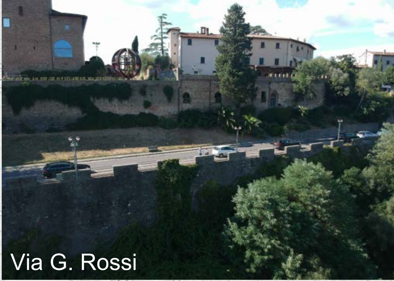
Via G. Rossi

L'area è importante per l'utenza turistica rivolta al Museo Leonardiano ed al borgo e come punto di partenza della "Strada verde", il percorso che da Vinci conduce alla Casa natale di Anchiano. Questo spazio appare oggi come una zona residuale, casualmente ritagliata dalla viabilità circostante, non facilmente accessibile e con arredi incongrui.