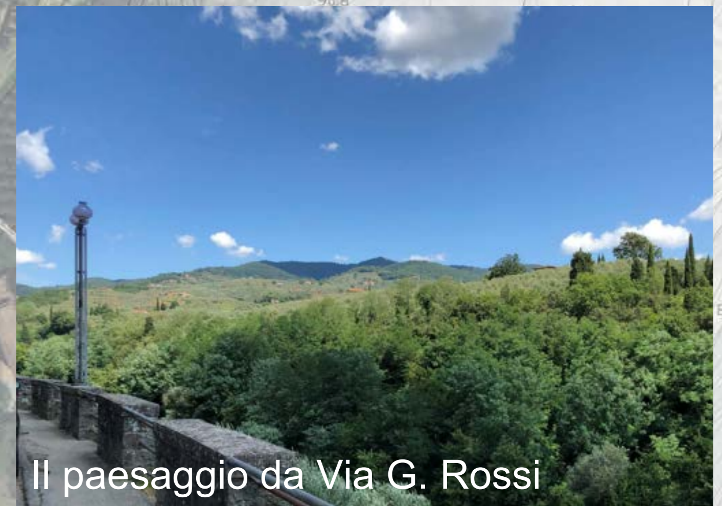
Il paesaggio da Via G. Rossi

Via Rossi offre scorci panoramici sui rilievi circostanti e sulla sottostante vallata percorsa da un torrente, lungo il cui corso sono ancora ben visibili i resti delle antiche pescaie dalla caratteristica morfologia a gradoni, che evocano le "scale d'acqua" di leonardiana memoria.