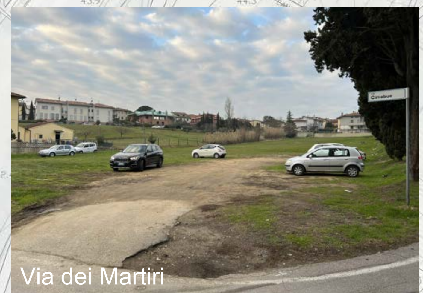
Via dei Martiri

Piazza della Libertà rappresenta lo spazio pubblico centrale del paese; essa è circondata dalle facciate della tipica edilizia dei primi decenni del '900. Purtroppo questa centralità ed i valori architettonici, che pure esistono, non sono percepiti per la presenza delle auto in sosta e per l'eterogeneità dei materiali e degli arredi visibili.