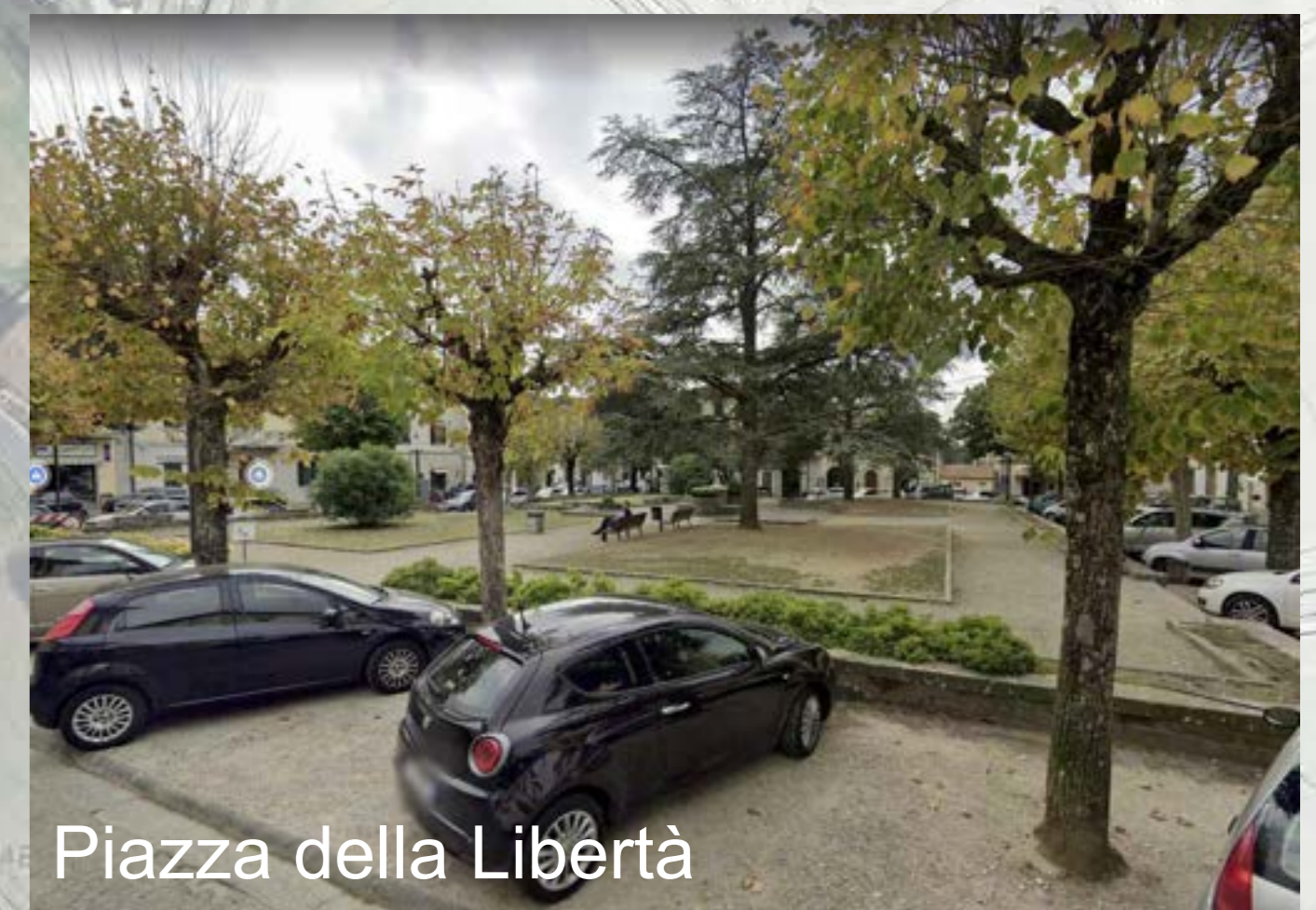
Piazza della Libertà

Via Rossi offre scorci panoramici sui rilievi circostanti e sulla sottostante vallata percorsa da un torrente, lungo il cui corso sono ancora ben visibili i resti delle antiche pescaie dalla caratteristica morfologia a gradoni, che evocano le "scale d'acqua" di leonardiana memoria.